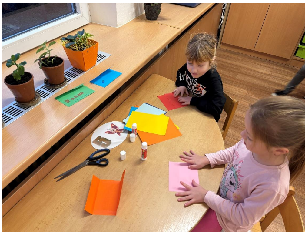
Zhotovení obálky na Swapíky