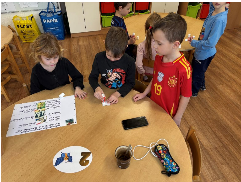
Tvorba pravidel SWAPu