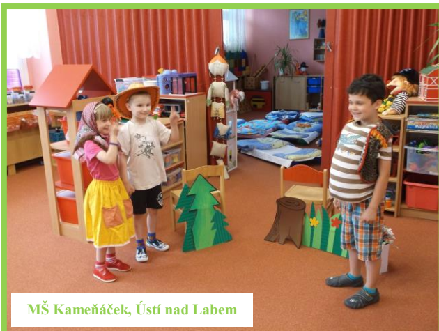
MŠ Kameňáček, Ústí nad Labem