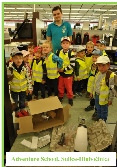
Adventure School, Sulice-Hlubočinka