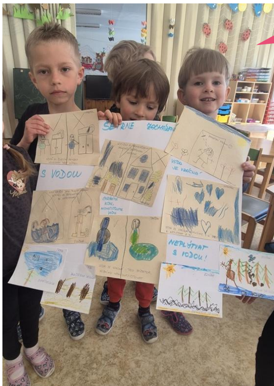
Mateřská škola Jilemnice – Sluníčko