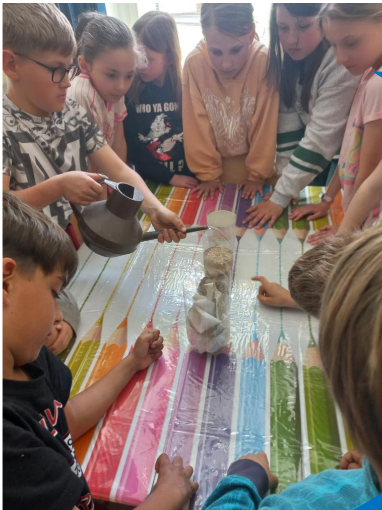
Základní škola a Mateřská škola Karlštejn