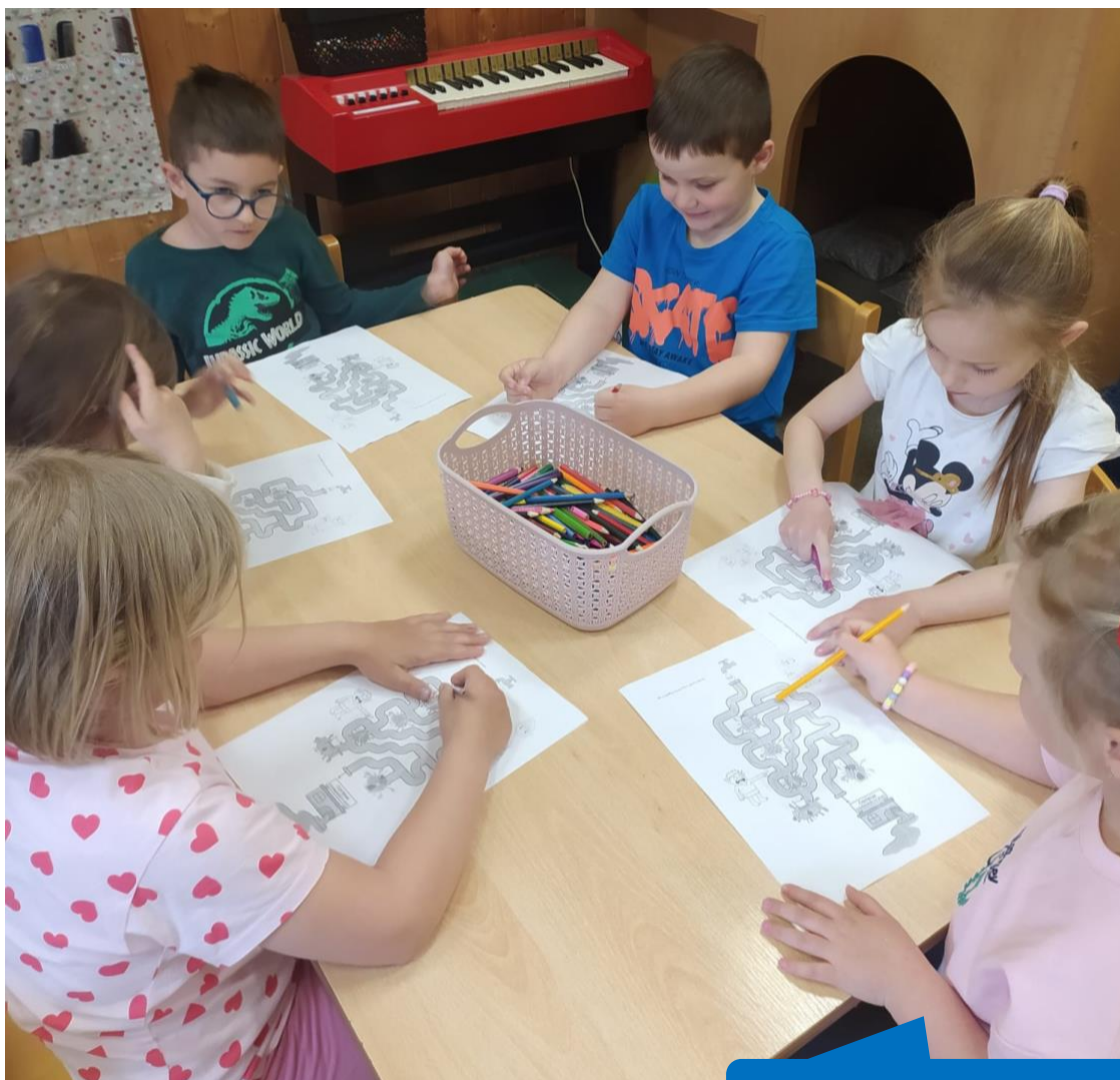
ZŠ a MŠ Chyňava