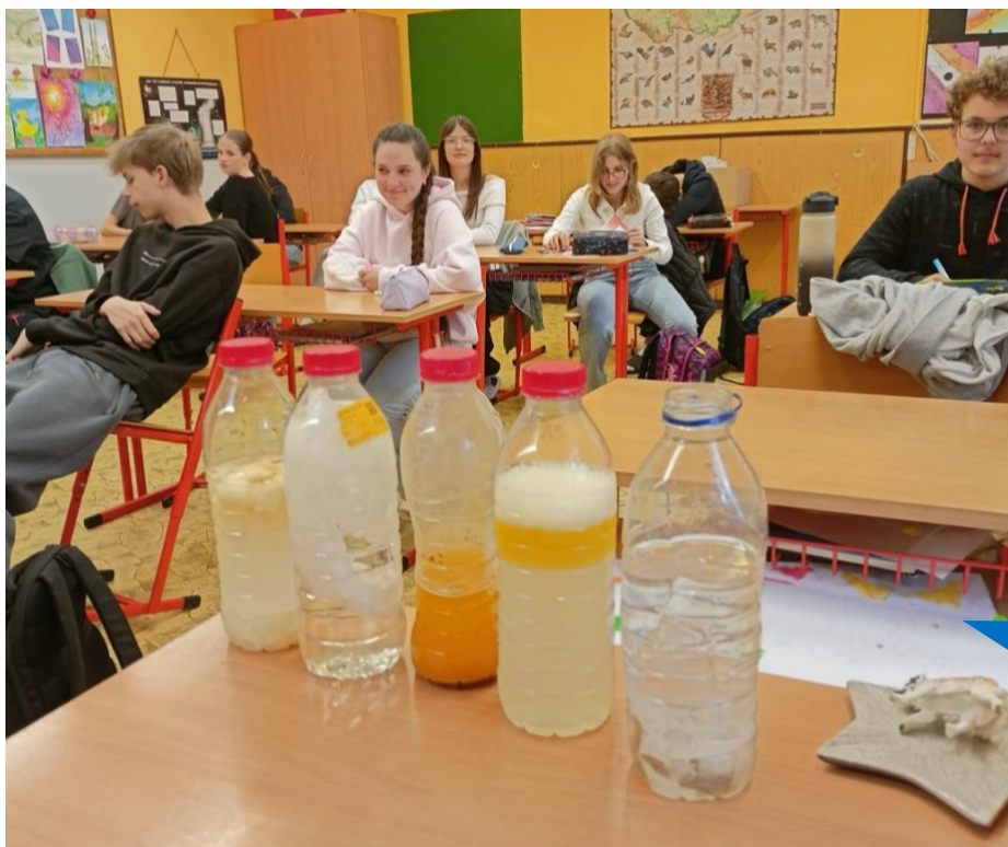
Základní škola a Mateřská škola Třebívlice