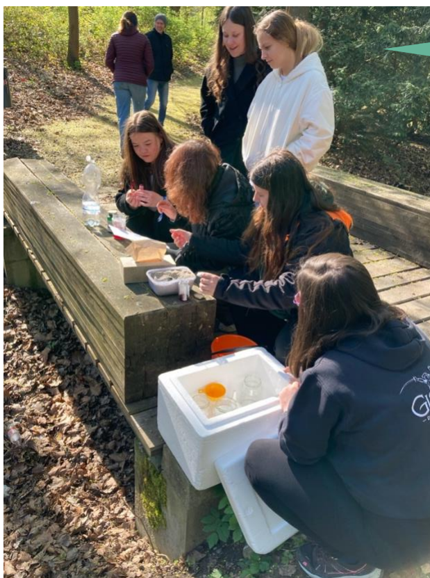
Hotelová škola, Plzeň, U Borského parku