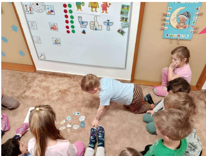
Mateřská škola Brandýs n.L. Stará Boleslav