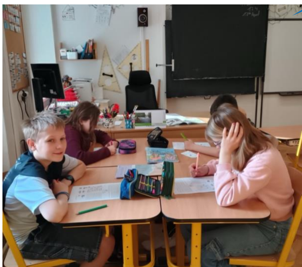
Základní škola a Mateřská škola Svatouch