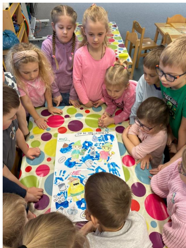
Mateřská škola Hostomice