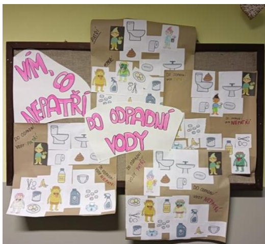
Základní škola a Mateřská škola Tochovice