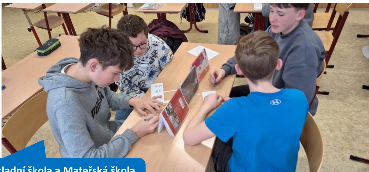
Základní škola a Mateřská škola Lipovec, okres Blansko