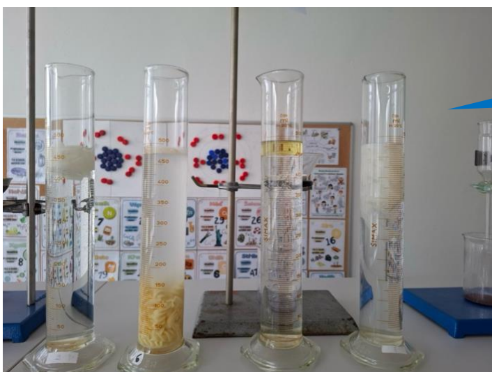
Základní škola Klimkovice