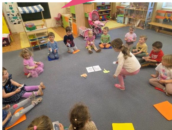
Základní škola a Mateřská škola Bystročice