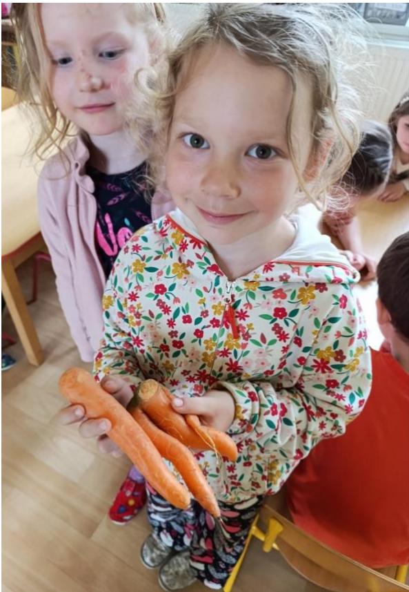
Mateřská škola Bezkov