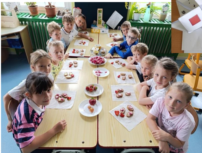
Základní škola a Mateřská škola Drmoul