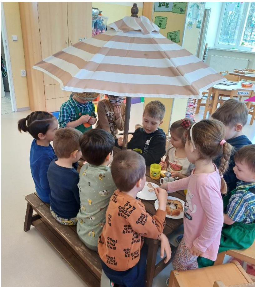
Základní škola a Mateřská škola Mostkovice