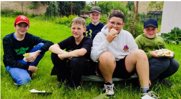
Základní škola Zaječice