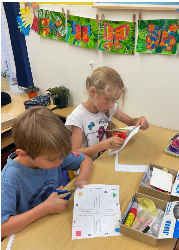
Základní škola Jalůvčí