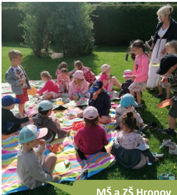
MŠ a ZŠ Hronov - Velký Dřevíč