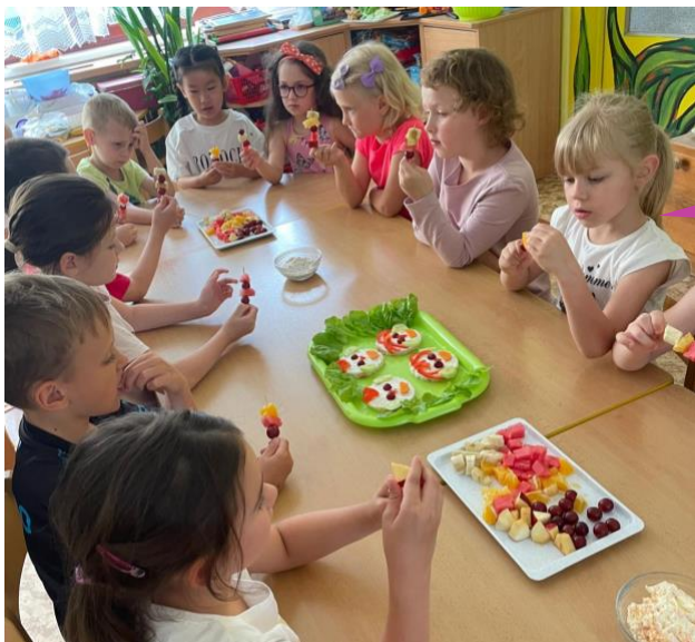
Mateřská škola Rozmarýnek, Praha 13