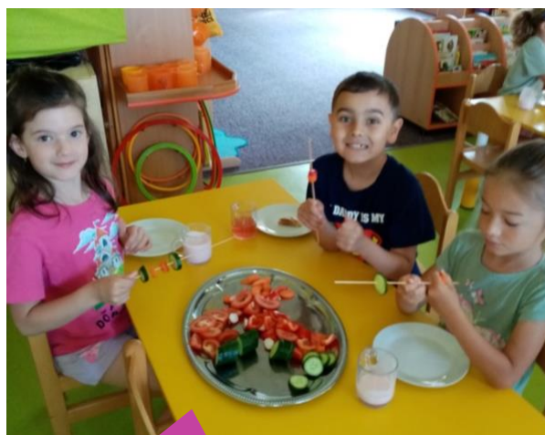
Mateřská škola Běstvina