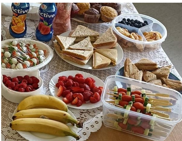
Základní škola Povážská Strakonice