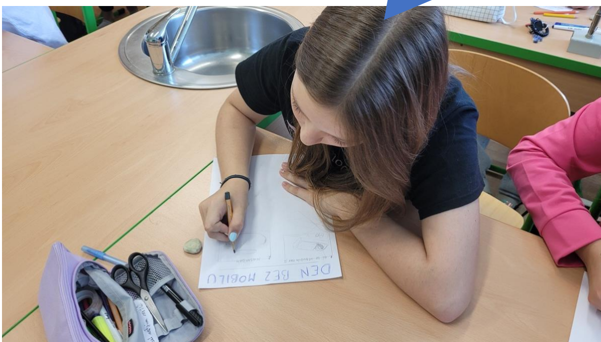
Základní škola Okříšky