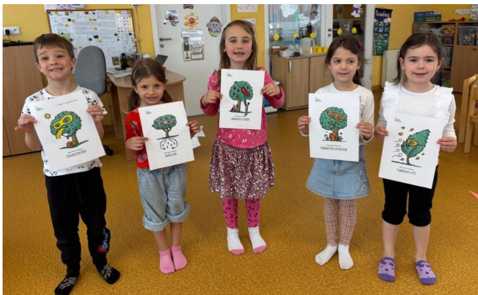
Mateřská škola Jinočany