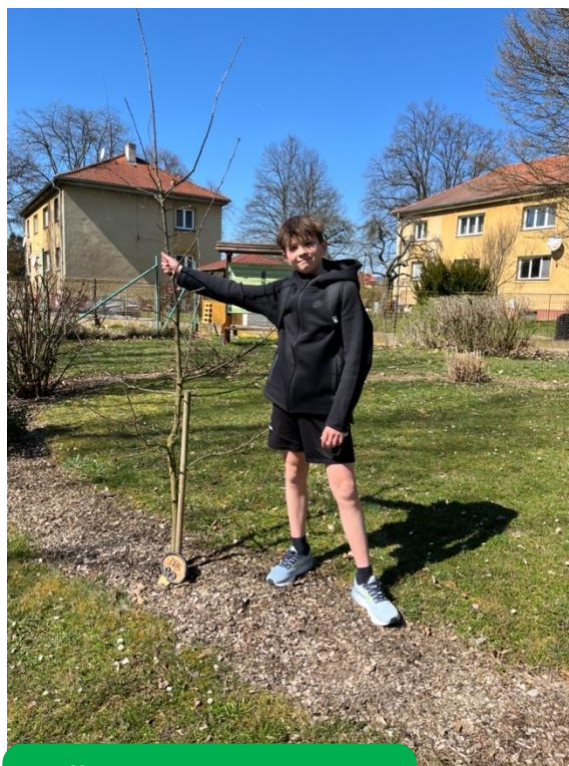
ZŠ J.J. Ryby Rožmitál pod Třemšínem