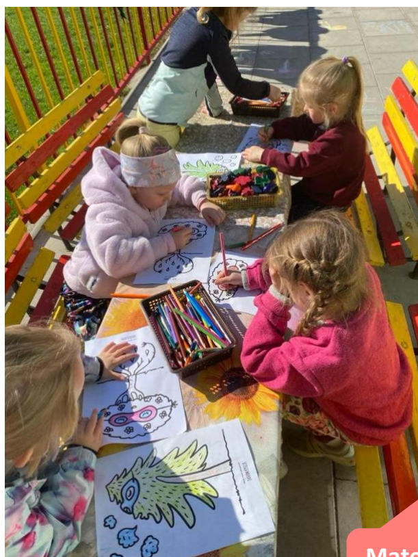
Mateřská škola Kovanice