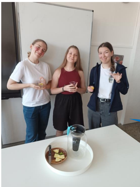
Gymnázium Brno, Elgartova