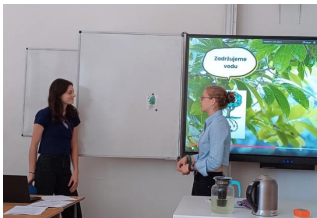
Základní škola a Mateřská škola Aloise Štěpánka, Dolany