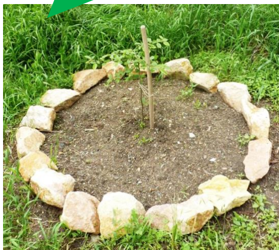
Základní škola Bruntál, Školní