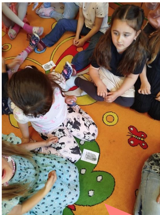
Základní škola Nepolisy