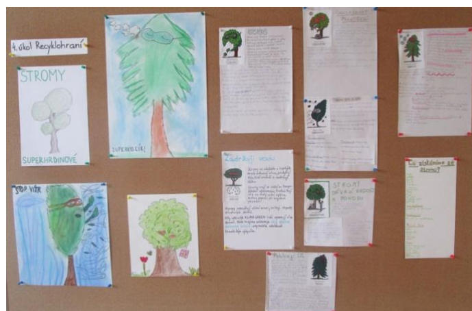
Základní škola Týnec nad Labem