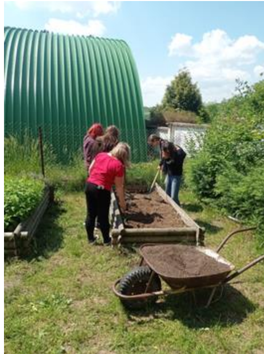
Základní škola a Mateřské škola Třeběnice