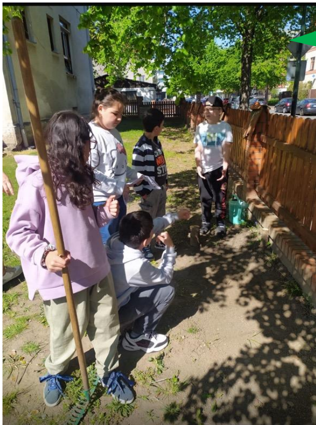
Dětský domov, Praktická škola, Základní škola a Mateřská škola Nymburk