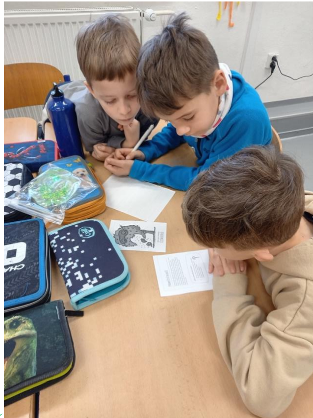
Základní škola Rychvald