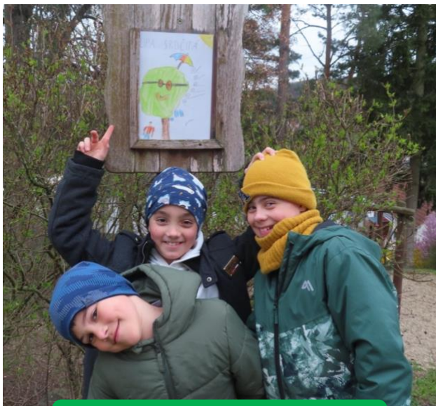
ZŠ a MŠ Nezdenice