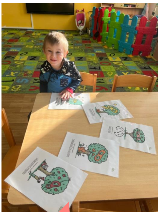
Mateřská škola Bulhary