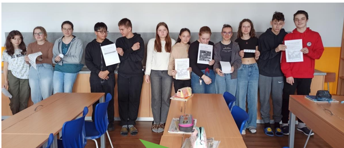
Základní škola a mateřská škola Košetice