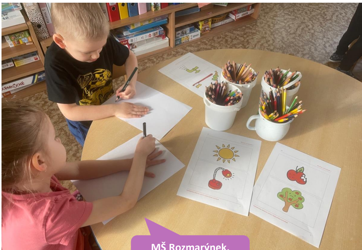
MŠ Rozmarýnek, Praha 13, Chlupova