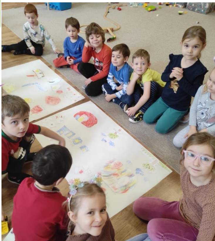
Mateřská škola Pavlov