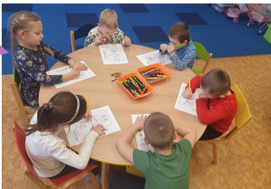
Základní škola a Mateřská škola Bystročice