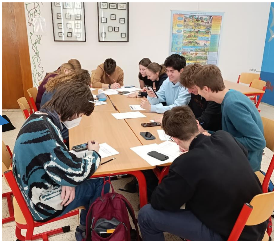
Gymnázium Vince Makovského Nové Město