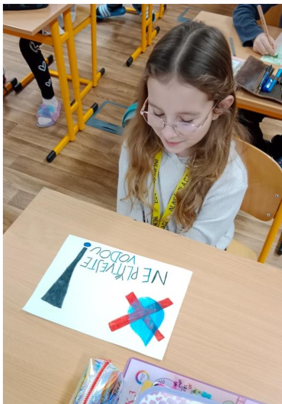
Základní škola J. A. Komenského Kly