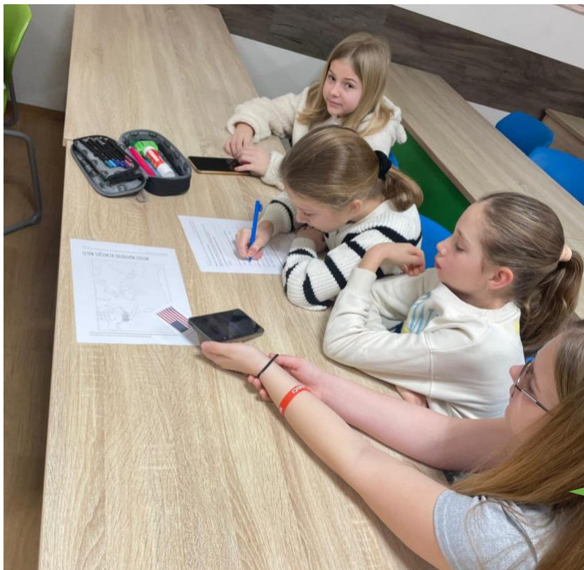
Základní škola T. G. Masaryka Milovice