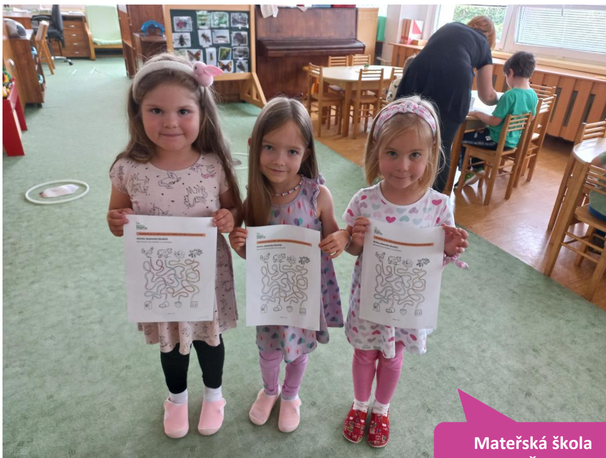
Mateřská škola Sovička, Česká Lípa