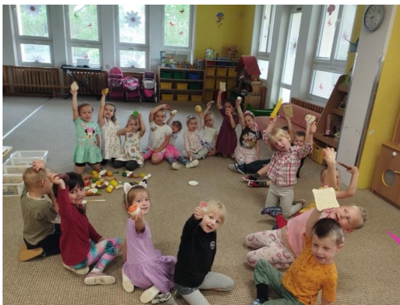
Mateřská škola Čáslav