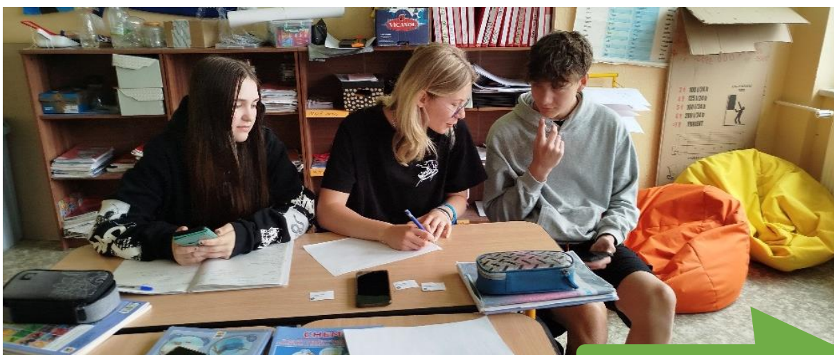
Základní škola Chyšky