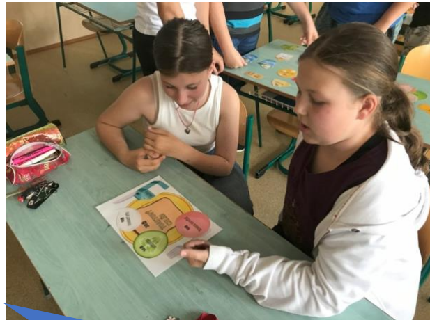
Základní škola a Mateřská škola Buchlovice