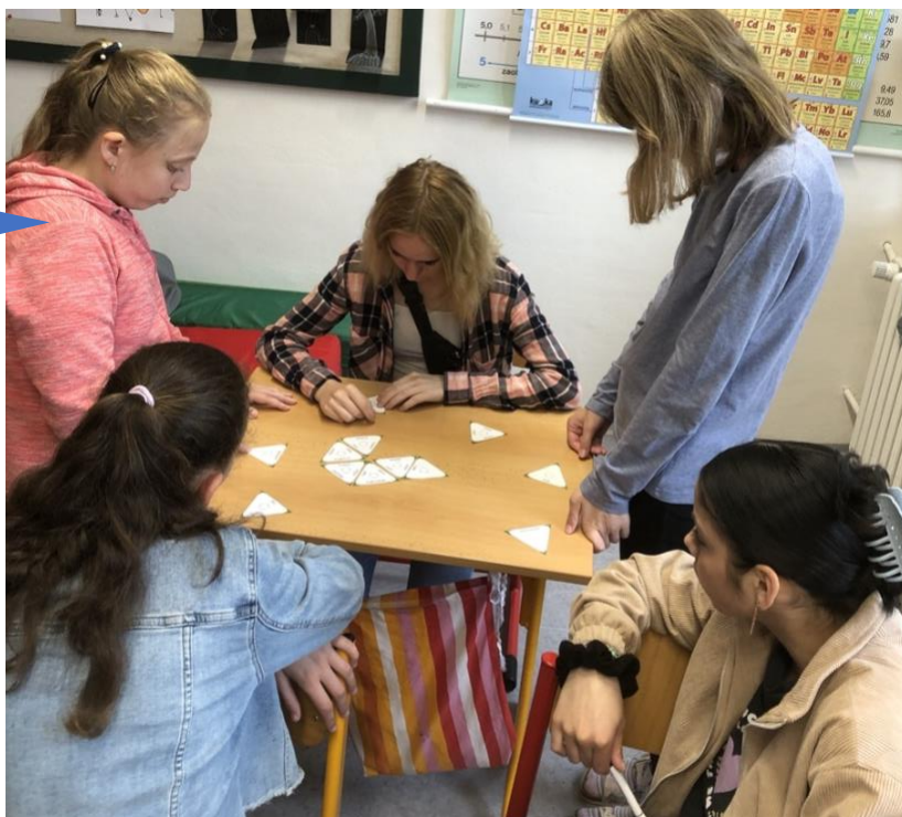
SŠ, ZŠ a MŠ Třinec, Jablunkovská