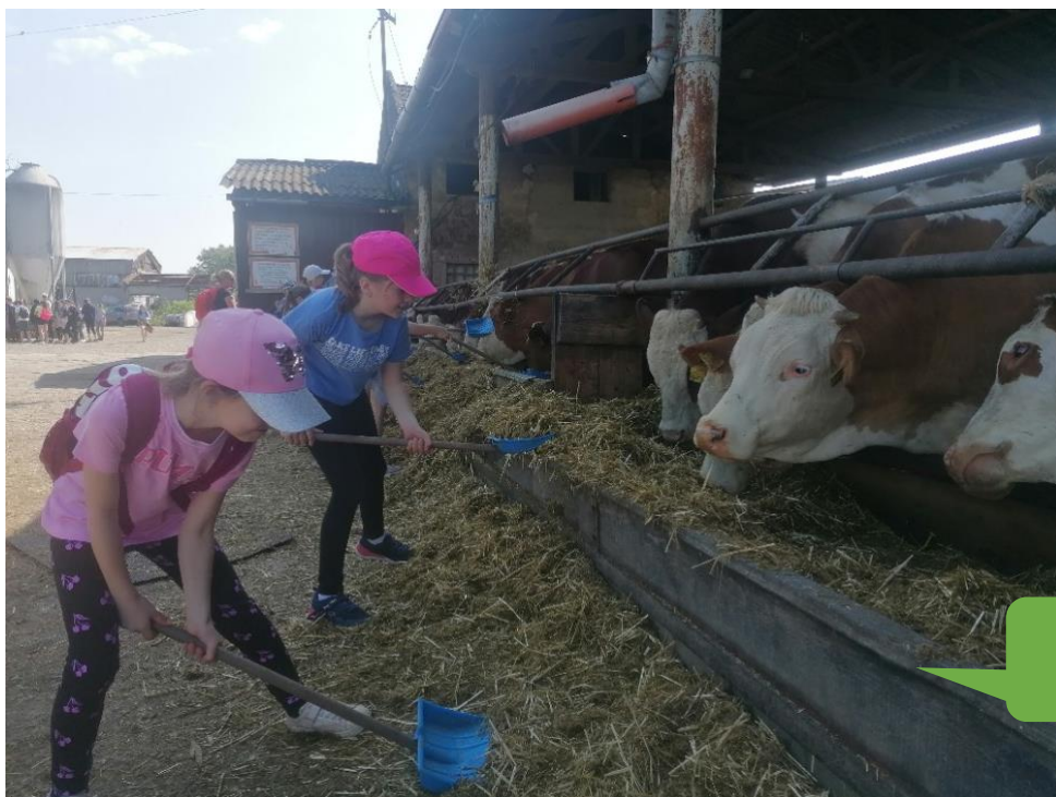
ZŠ a MŠ Přemyslovice