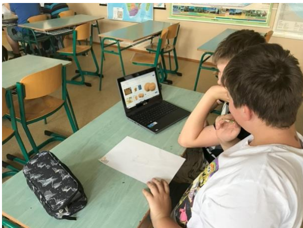
Základní škola Březová nad Svitavou