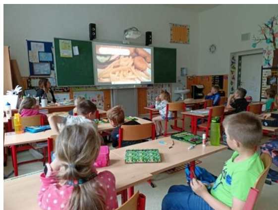
Základní škola Oskol Kroměříž