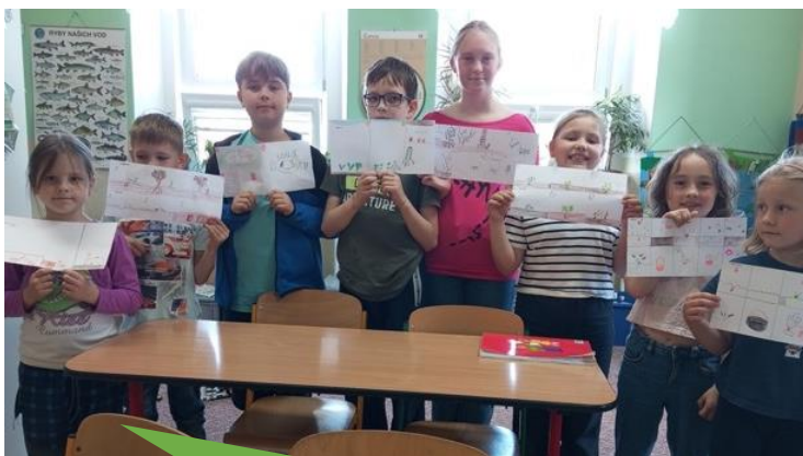
Základní škola Lhotky, Velké Meziříčí