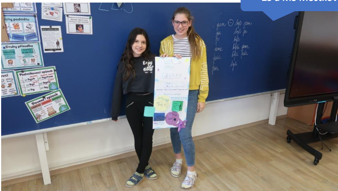
ZŠ a MŠ Mostkovice