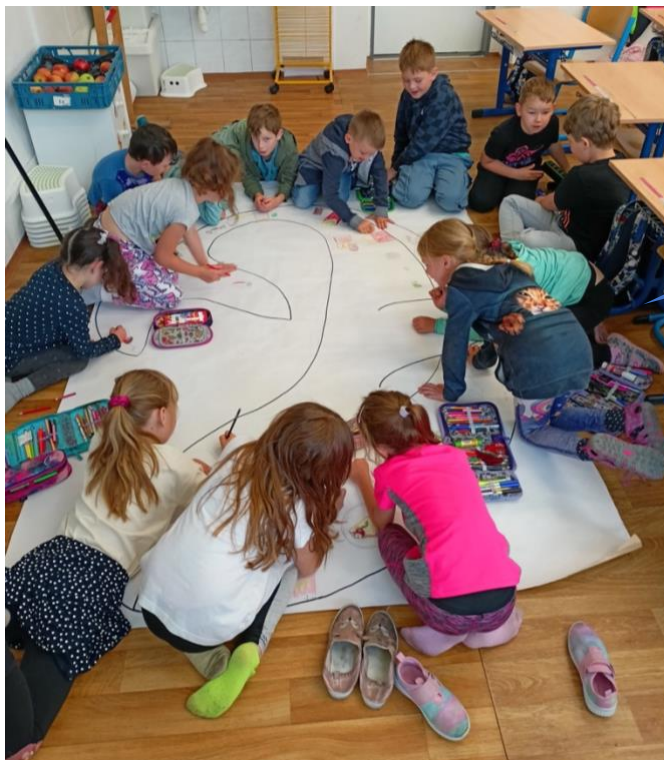
Základní škola Libuš