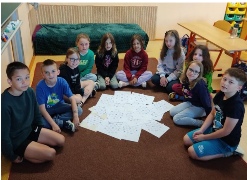
Základní škola Třešť