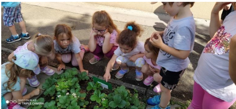
Mateřská škola Nad Parkem