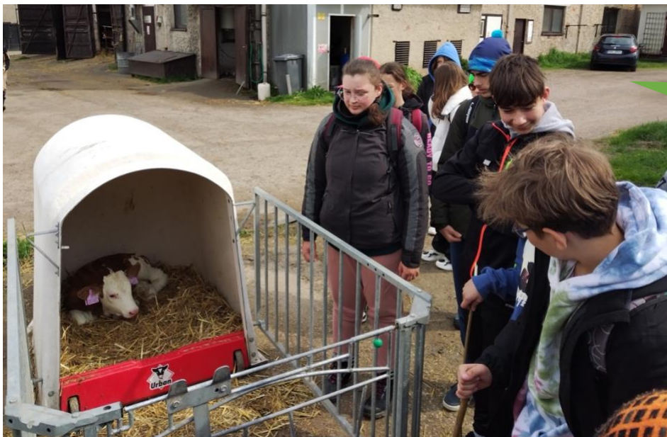
Základní škola Vamberk