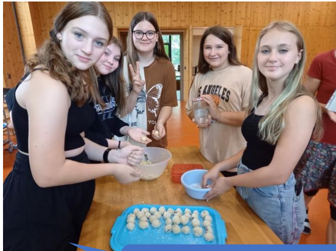
Základní škola Ronov nad Doubravou