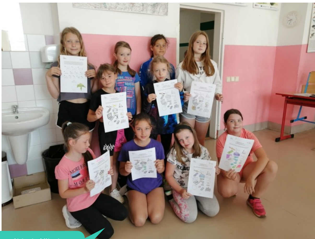
Základní škola Trutnov, Komenského