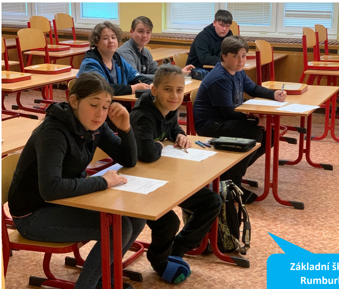
Základní škola Rumburk, U Nemocnice