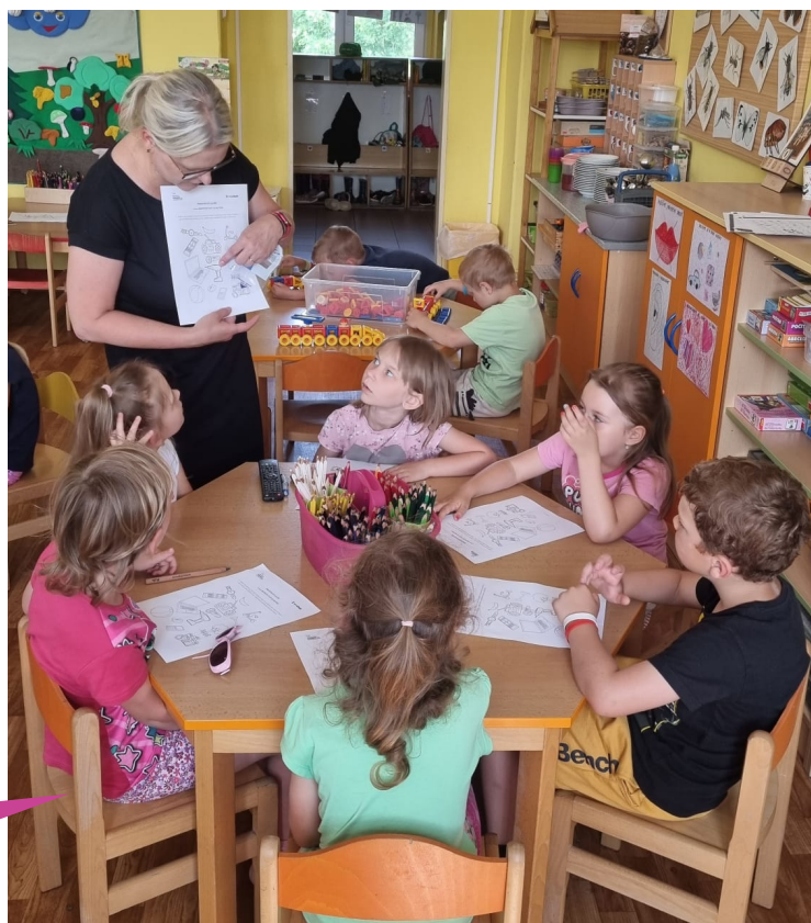
Mateřská škola Sluníčko, Krupka