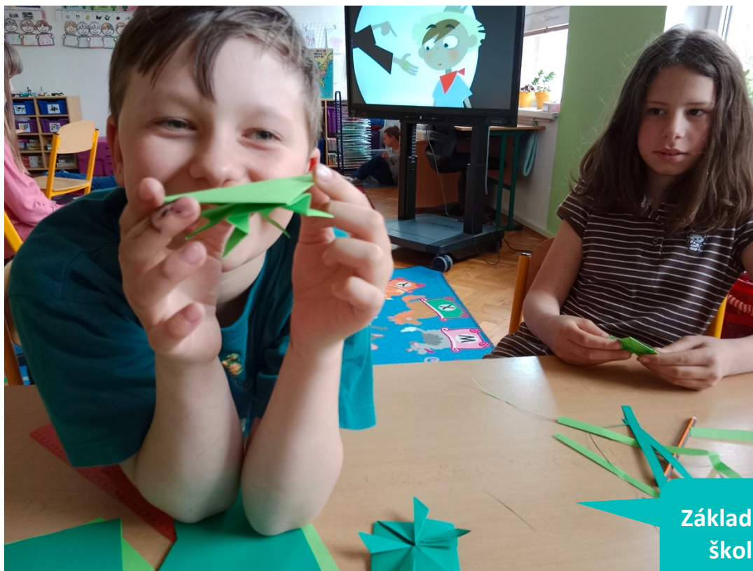
Základní a Mateřská škola Vidochov