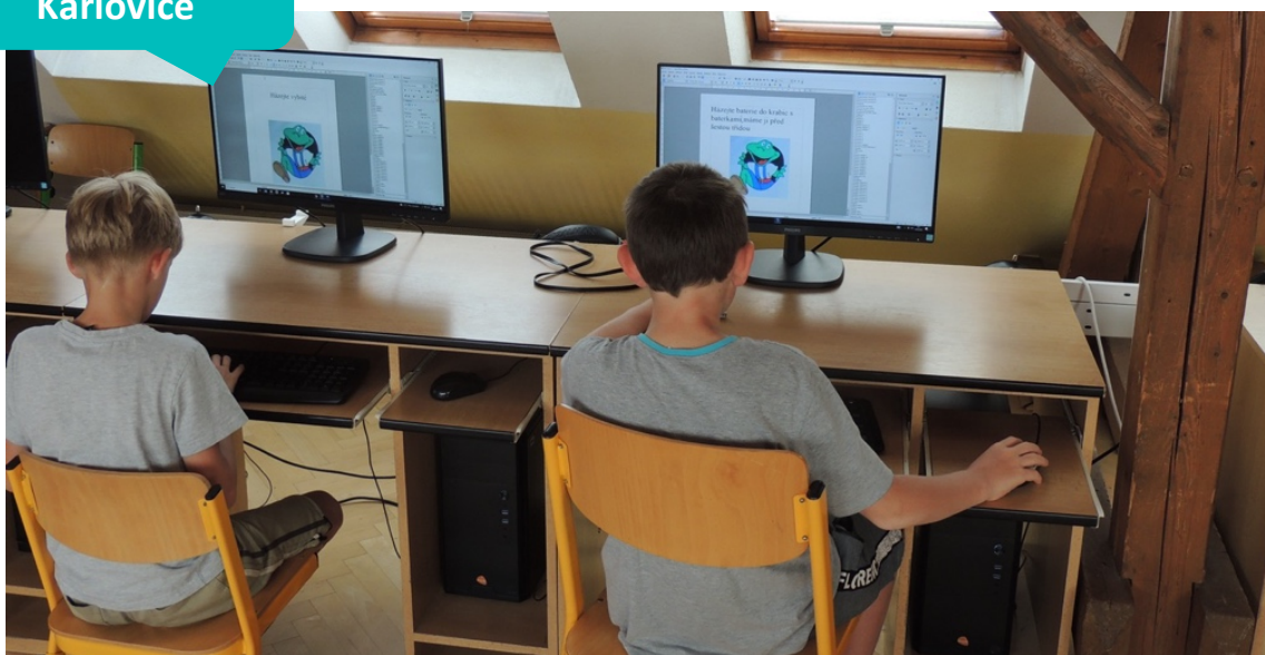
Základní škola Karlovice