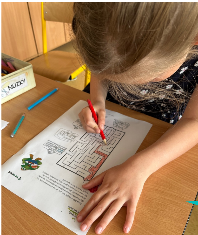
Základní škola Heřmanice u Oder