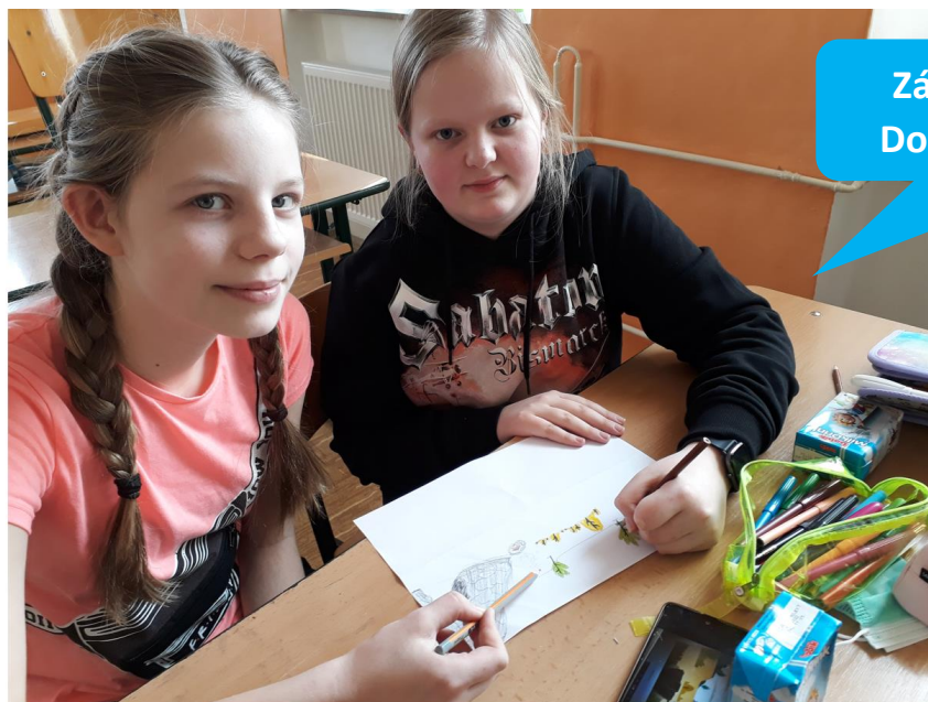
Základní škola Ronov nad Doubravou, okres Chrudim