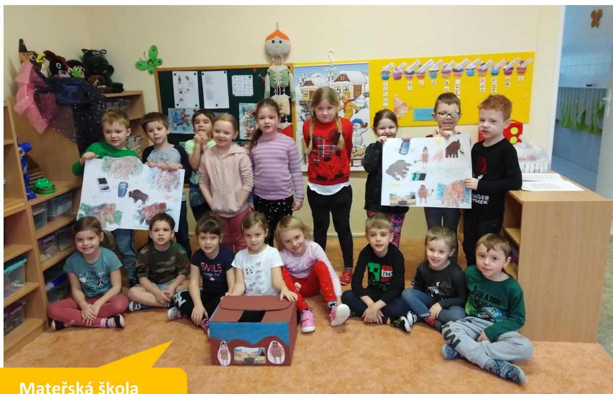
Mateřská škola Motýlek, Pardubice