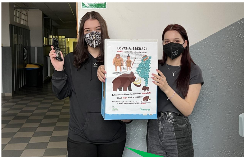
Hotelová škola, Plzeň, U Borského parku