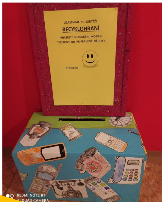
Základní škola a Mateřská škola Libáň, okres Jičín