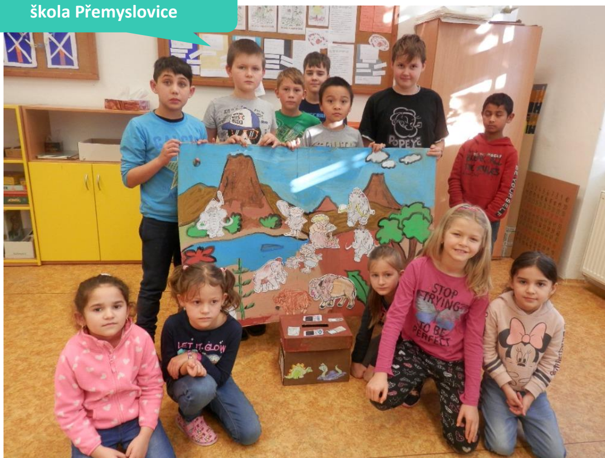
Základní škola a Mateřská škola Přemyslovice