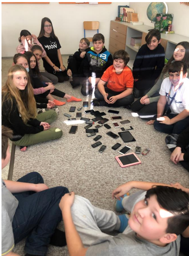
Základní škola a Mateřská škola Polnička, okres Žďár nad Sázavou