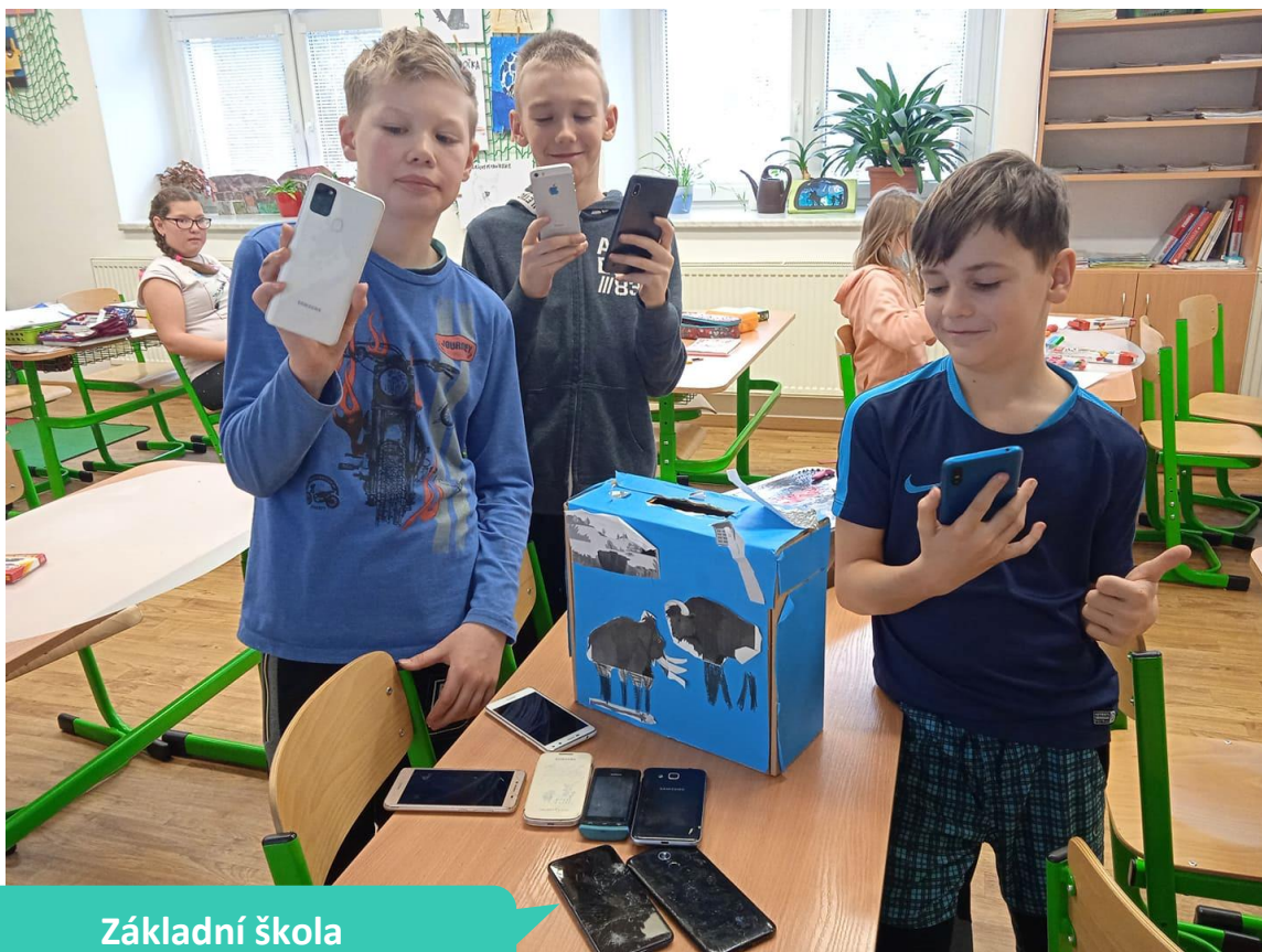
Základní škola Janov, okres Svitavy