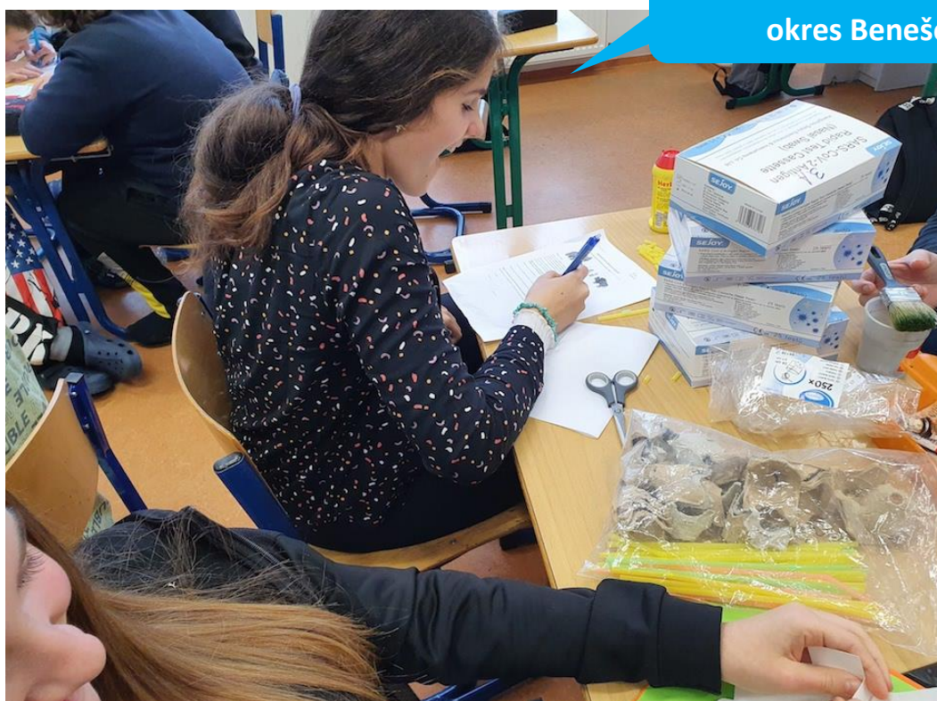
Základní škola Neveklov, okres Benešov