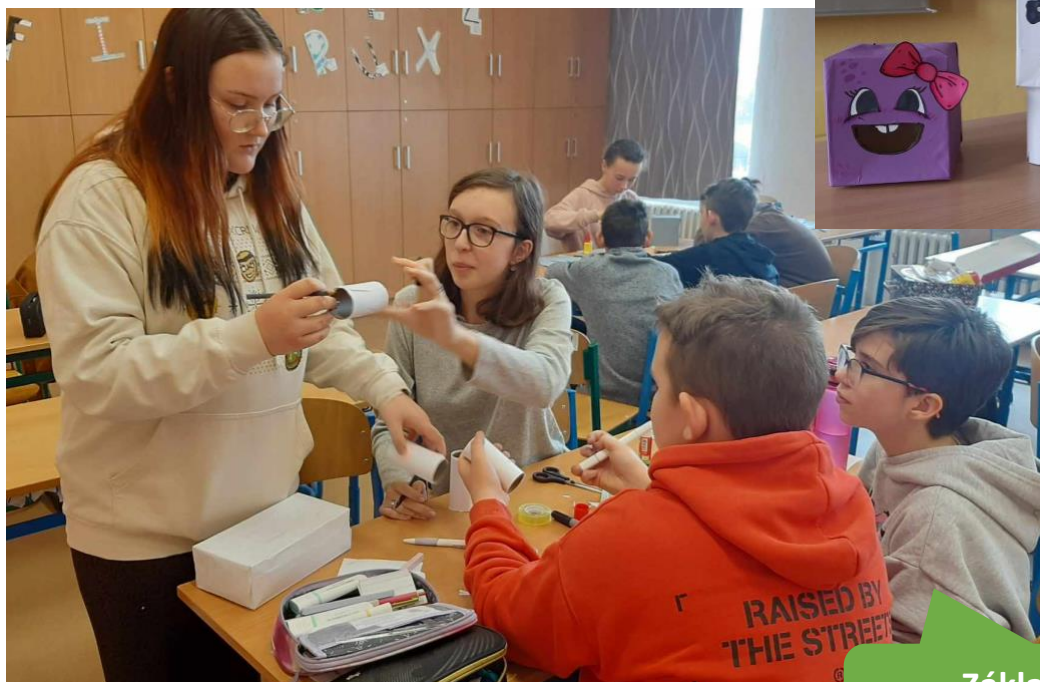
Základní škola a mateřská škola Třebíče