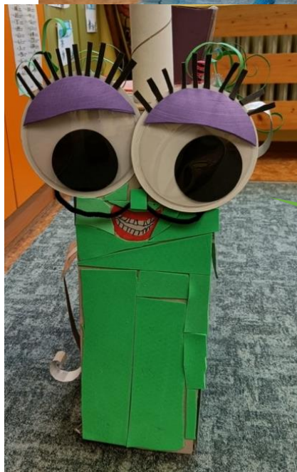
Základní škola Hýskov