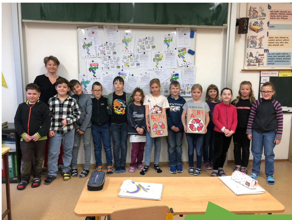
Základní škola a mateřská škola Černovice