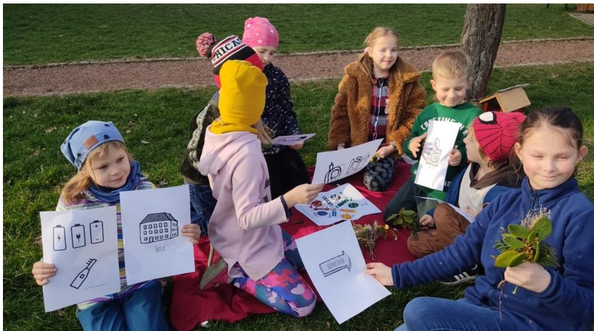
Polská základní škola – Polska Szkoła Podstawowa