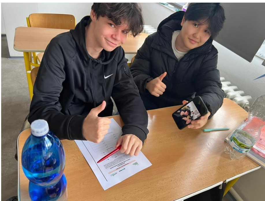
SŠTŘ Hermés Mladá Boleslav