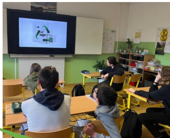
Základní škola a Mateřská škola Cehnice