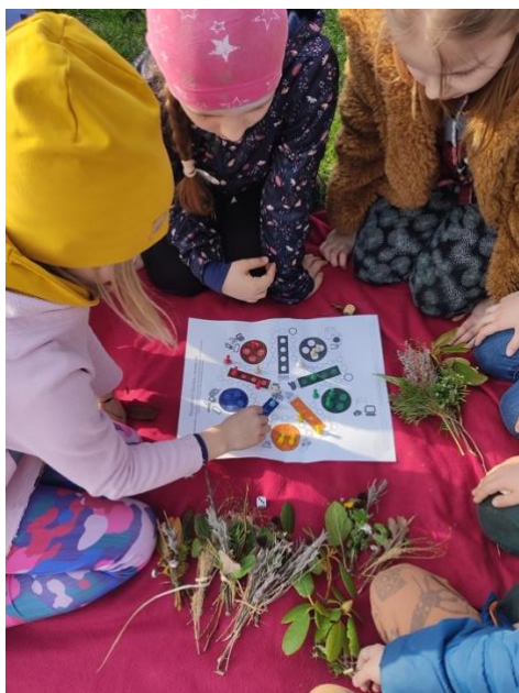
Základní škola a Mateřská škola Bezměrov