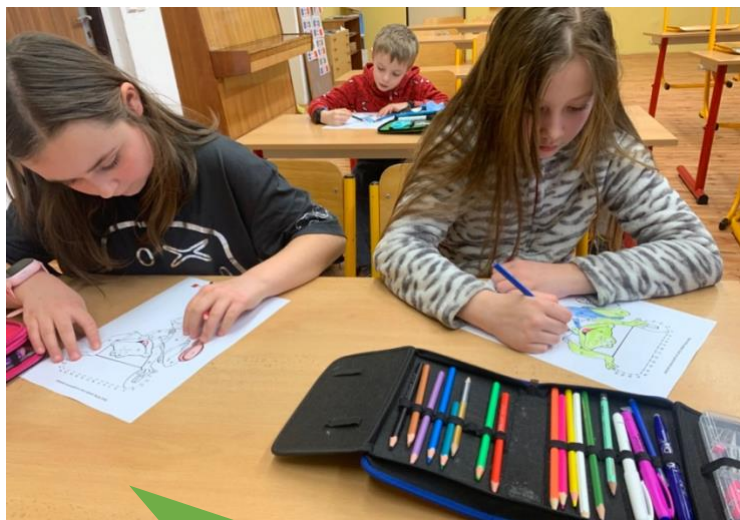
ZŠ a MŠ Ostrava - Bělský Les