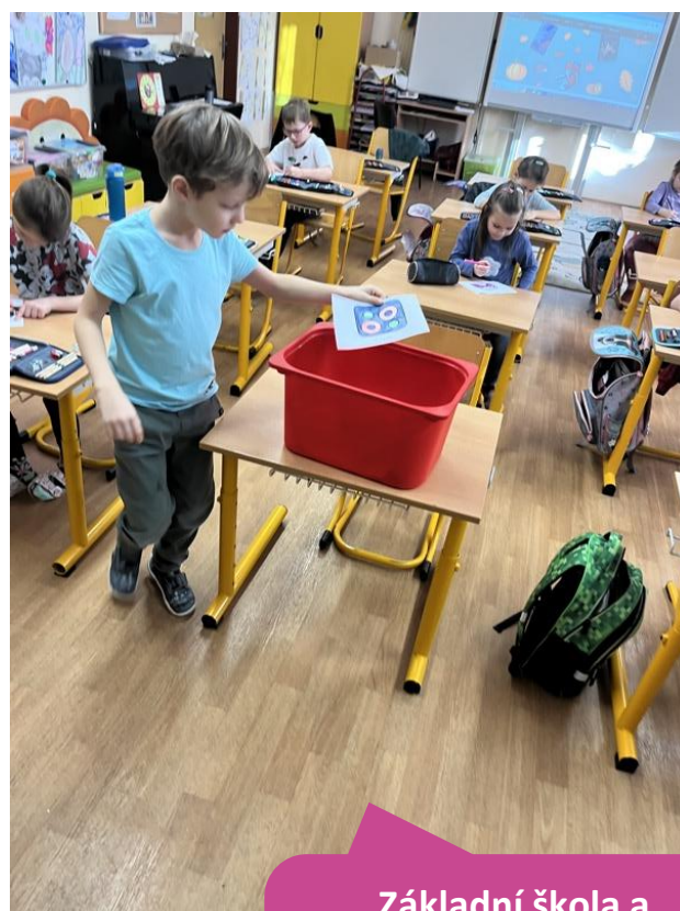
Základní škola a mateřská škola s polským jazykem vyučovacím, Třinec