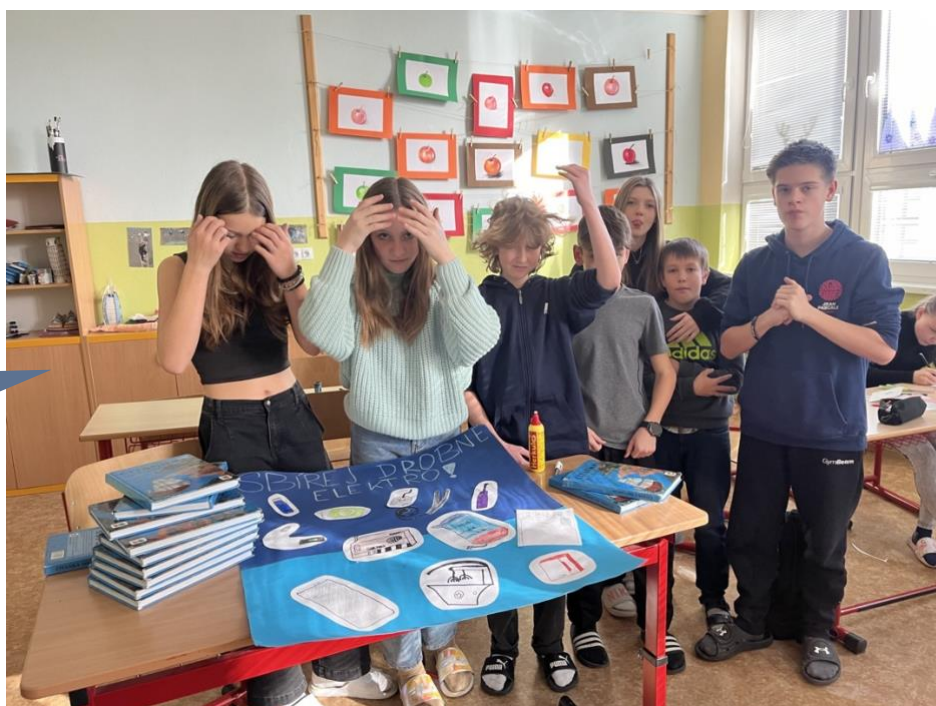
Základní škola Kaplice