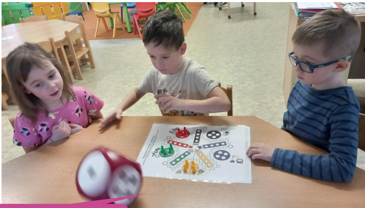
Základní škola a mateřská škola Tetce