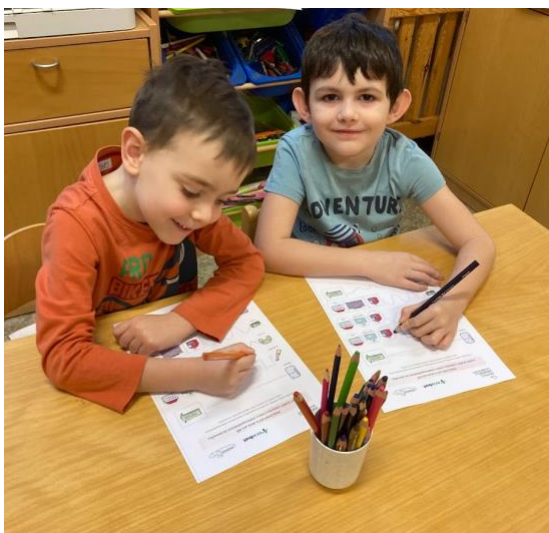
Mateřská škola Motýlek Pardubice